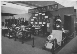
Vue sur le Stand GaiFFE-Gaillet-Pilon.

Cette maison exposait également un appareil intéressant dit «radio-coffret». C'est un coffret métallique doublé de plomb, renfermant dans l'huile une minuscule ampoule Coolidge à radiateur. Le dessus de la boîte porte une fenêtre transparente munie d'un diaphragme. Deux conducteurs à grand isolement amènent le courant d'un transformateur facilement portable. Cet appareil, qui fonctionne sous une tension maxima de 80 kilovolts est tout spécialement indiqué pour les radiographies à domicile ou sur les tables d'orthopédie chirurgicale. Quoique très réduit, ce dispositif